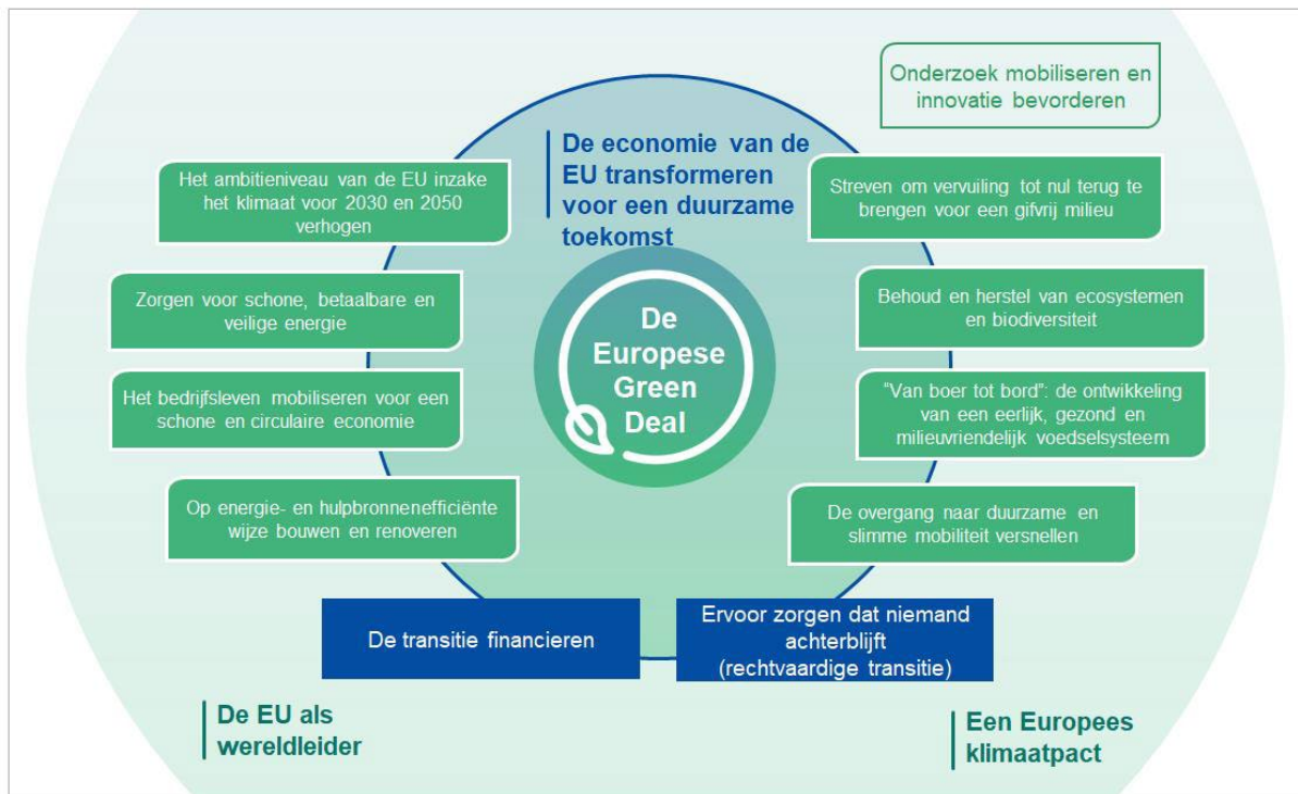
Figuur 1: De Europese Green Deal

De Europese Green Deal is de routekaart om de economie van de EU duurzaam te maken. Dat lukt alleen als we op alle beleidsdomeinen de klimaat- en milieuproblemen aangrijpen als een kans om de transitie voor iedereen zo rechtvaardig en inclusief mogelijk te maken.