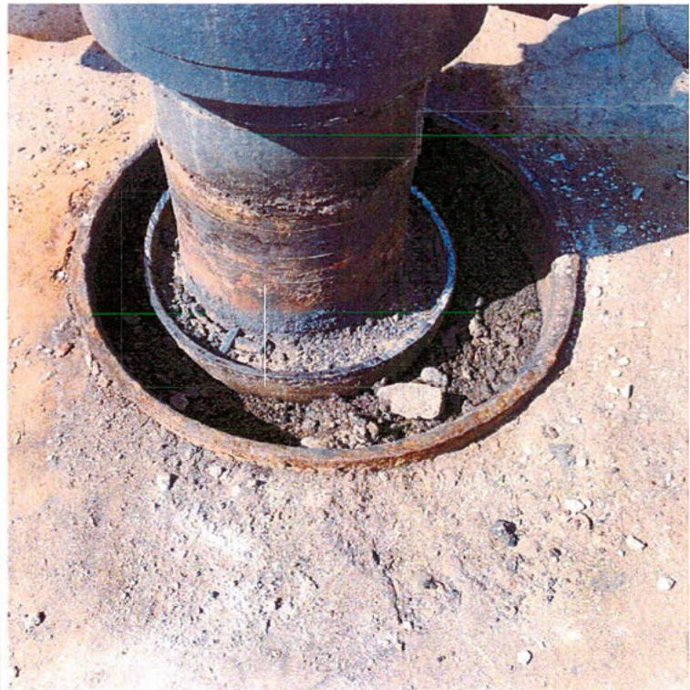
Afbeelding 4: MDM-GT-03 status 22-08-2019