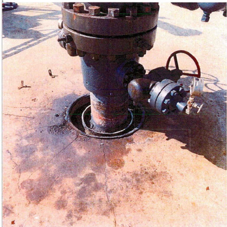
Afbeelding 3: MDM-GT-04 status 22-08-2019